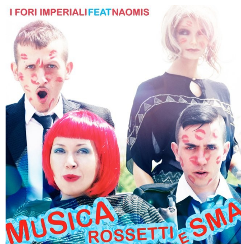
La copertina del singolo "Musica rossetti e SMA"

Ovviamente sì! Con quel testo, non potevano che esserci rossetti, parrucche e colori scintillanti! In un mondo in cui padroneggiano i sistemi rappresentazionali visivi, il video doveva avere un ruolo fondamentale.